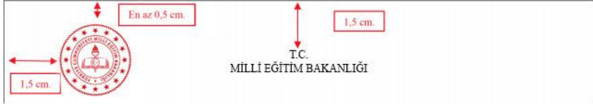
Şekil 1 Belgenin Üst Sol Kısımında Tek Logo Kullanım Örneği

Logonun solda kullanıldığı durumlarda sayfanın üst kenarı ile başlık arasında 1,5 cm boşluk bırakılması gerekmektedir. Sayfanın üst kenarı ile logo arasında 0,5 cm boşluk ve sol kısım ile logo arasında 1,5 cm boşluk bırakılması gerekmektedir.