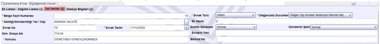
Şekil 18 Gelen Evrak Kayıt Ekranında Olağanüstü Durumla İlgili Girilecek Üst Veri Alanları